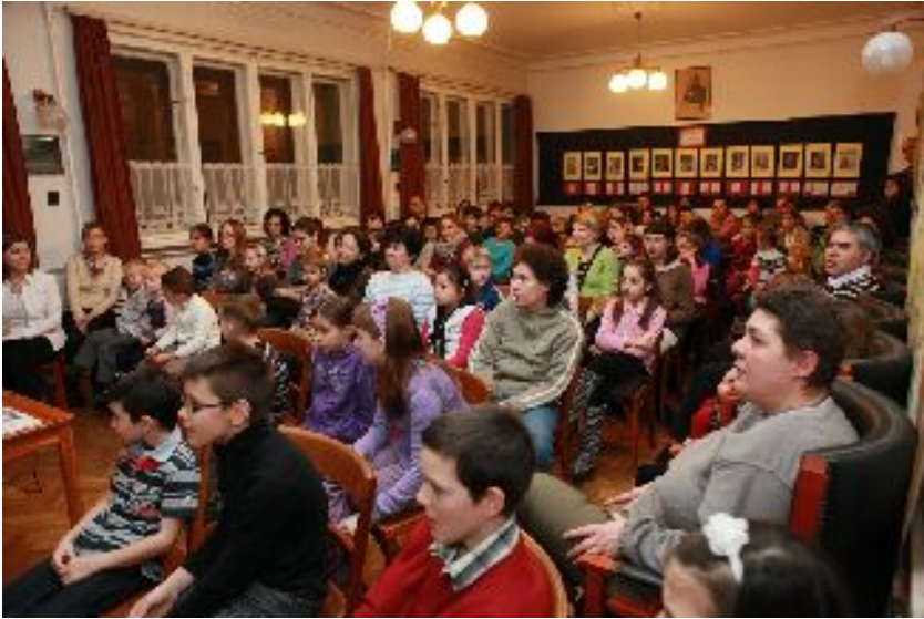
„...az angyali seregek vígan így énekelnek...”