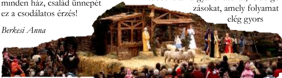
Betlehemes előadás Németországban