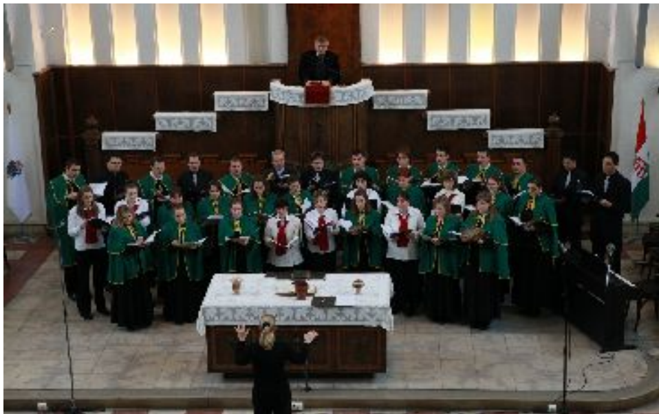
A Hálaadás kórus és a Kántus közös szolgálata