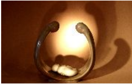
Betlehemes (szappankő, Kenya)

A reggeli ébredést követően nyilván sokan töprengünk azon, vajon milyen nap vár ránk. Időben beérünk-e a munkahelyünkre? El tudjuk-e végezni az elvárásoknak megfelelően az előttünk álló feladatokat? Adódik-e felesleges bosszúság a munkahelyi környezetben? Munka után, esetleg ebédszünetben, el tudjuk-e intézni az esedékes hivatalos teendőinket? Sajnos tendencia, hogy többségében vannak közöttünk azok, akik számára a nap „sikeressége” már reggel, ébredéskor eldől. Akik aggodalmaskodva, félelemmel terheltén vágnak neki a napi fáradalmas mókuseréknek. Akiiket a napi rutin olyannyira megterhel, ki merít és reménytelenségbe taszít, hogy hosszú távon az egészségük bánja a hajtást, a megállni, kikapcsol-