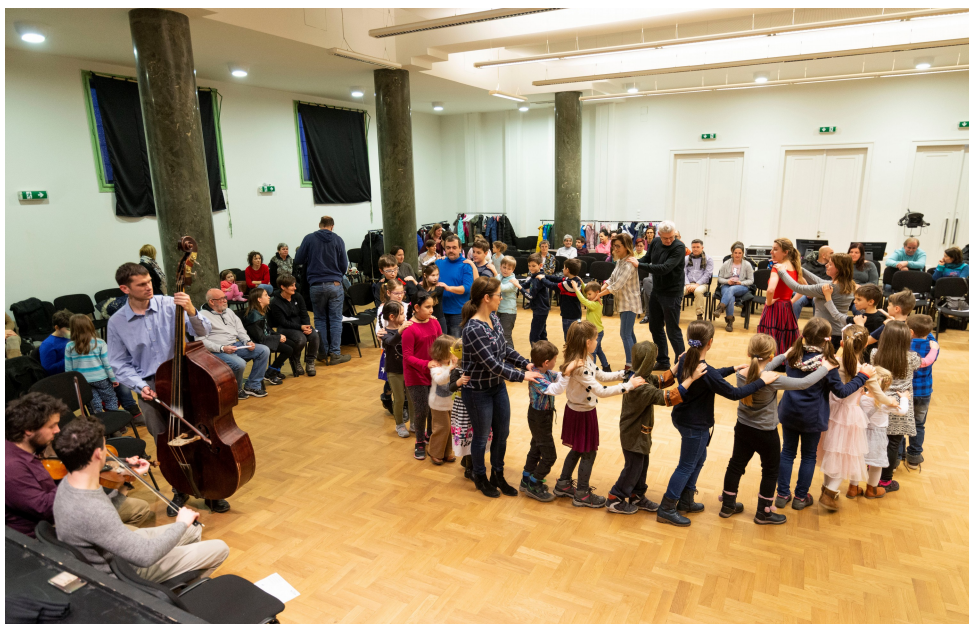
Magyar táncház közben az altemplomban