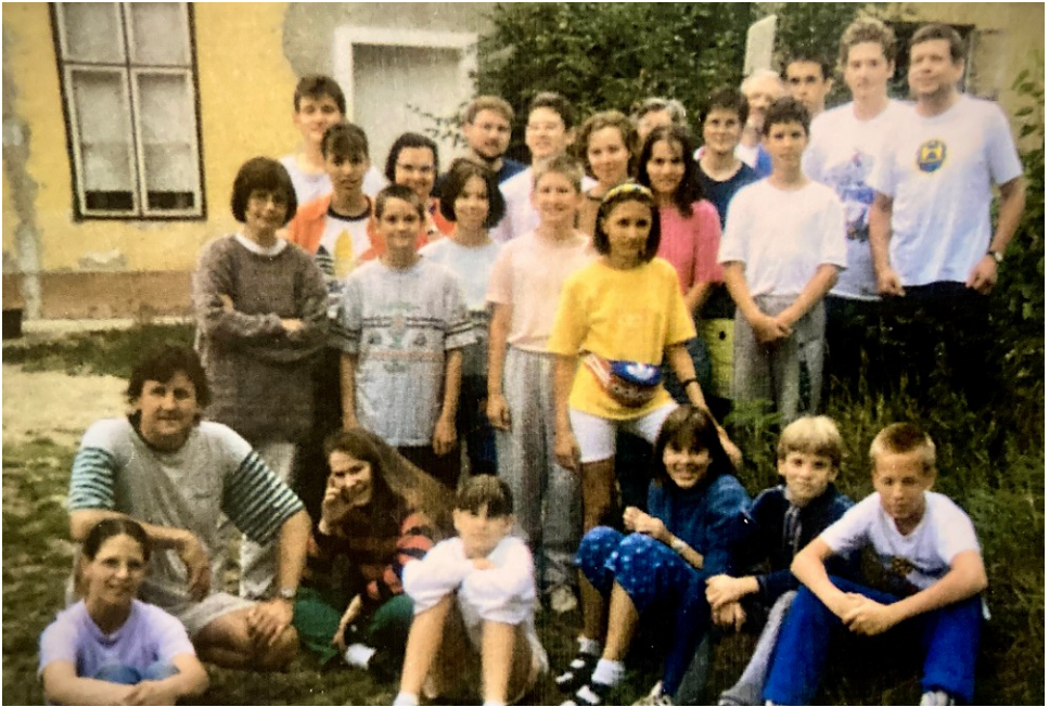
Egyik első táborunk Szokolyán, a kilencvenes években