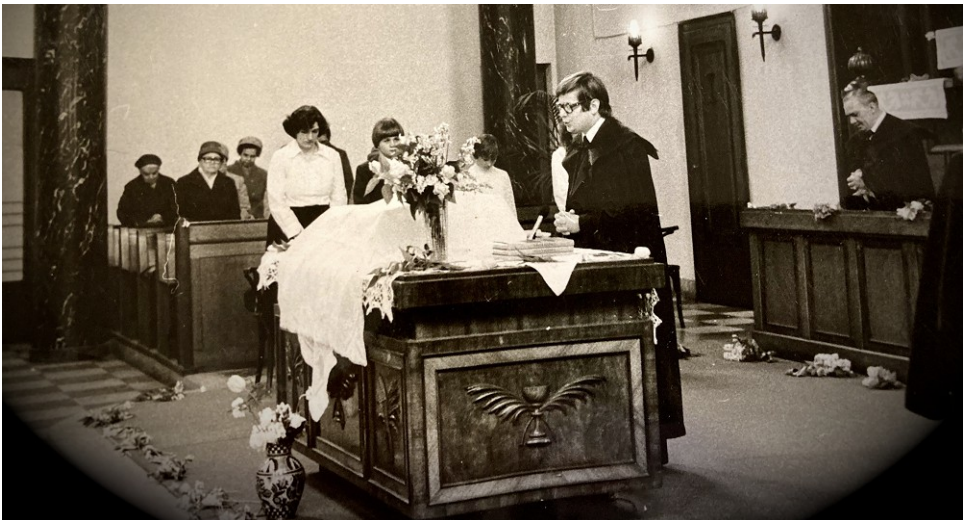
Konfirmáció a betvenes éveken...