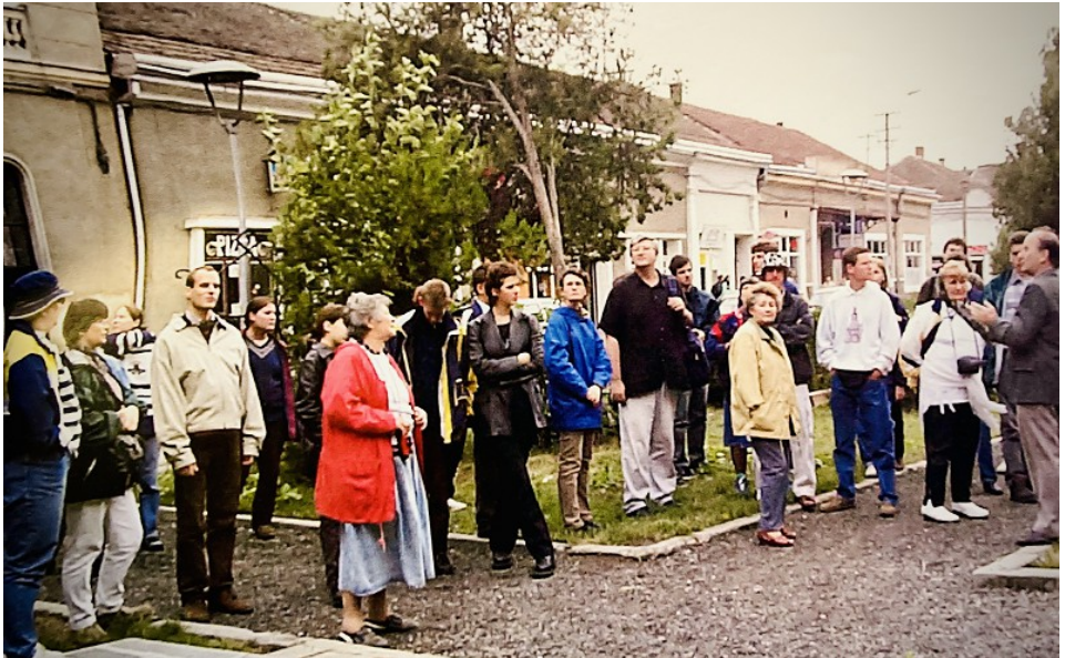
Erdélyi kirándulás a kétezres évek elején Kerekes tanár úrral