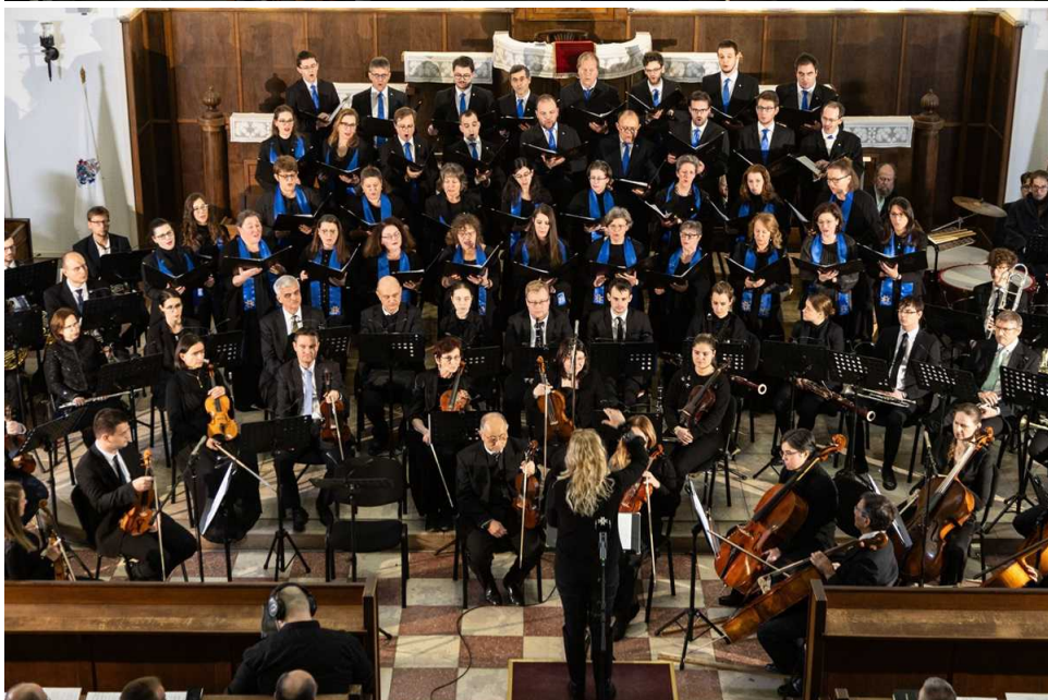
December 16-án a Központi Református Kórus adott koncertet templomunkban