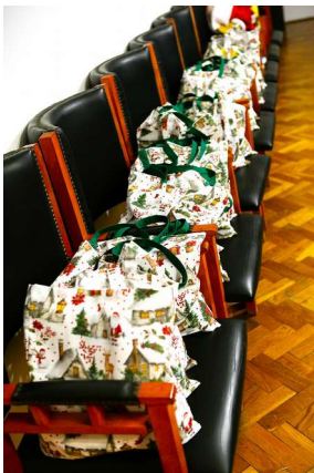
Új köntösben a karácsonyi csomagok